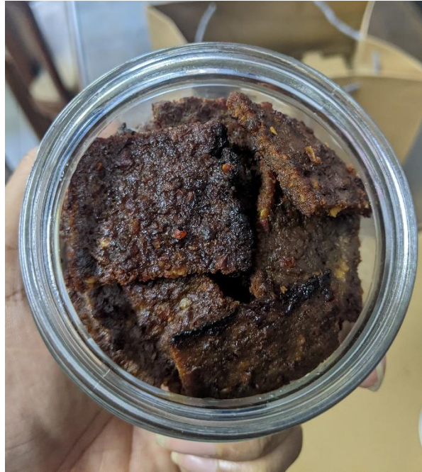
Gambar 1. Finished Product (Sumber: Dokumentasi Pribadi)